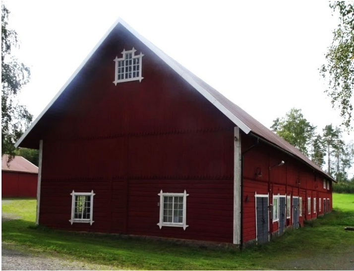
Ladugården på Äsperyd 1:2

Längs vägen ligger även en välbevarad liggtimrad ladugård med stor volym på Äsperyd 1:2. Ladugårdens övre del består av stående panel som avslutas i spets ner över timret. Småspröjsade fönster i vitt, bestående av 8x8 rutor vid sidan av ett bredare mittparti. Vitmålade foder med spetssågade hörn och svarta dörrar. Rött plåttak. Rött plåttak.