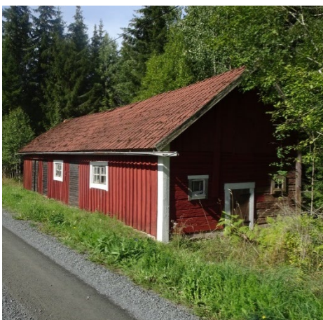
Äsperyd 1:7, Ljungholmen