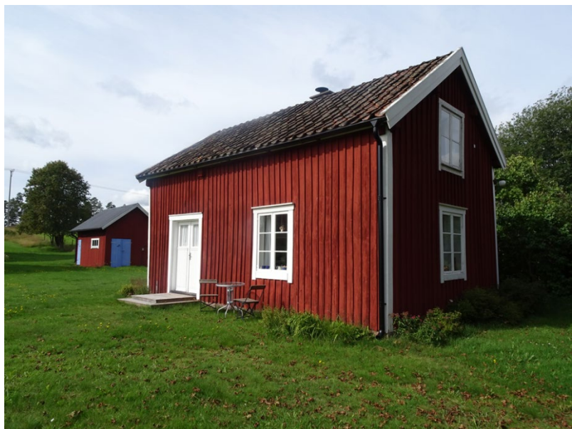
Äsperyd 1:27, Vindåker.

Timrad farstu på stugans baksida. Rött enkupigt tegeltak. Delvis bevarad interiör med kakelugn och äldre kök, ej indraget vatten.