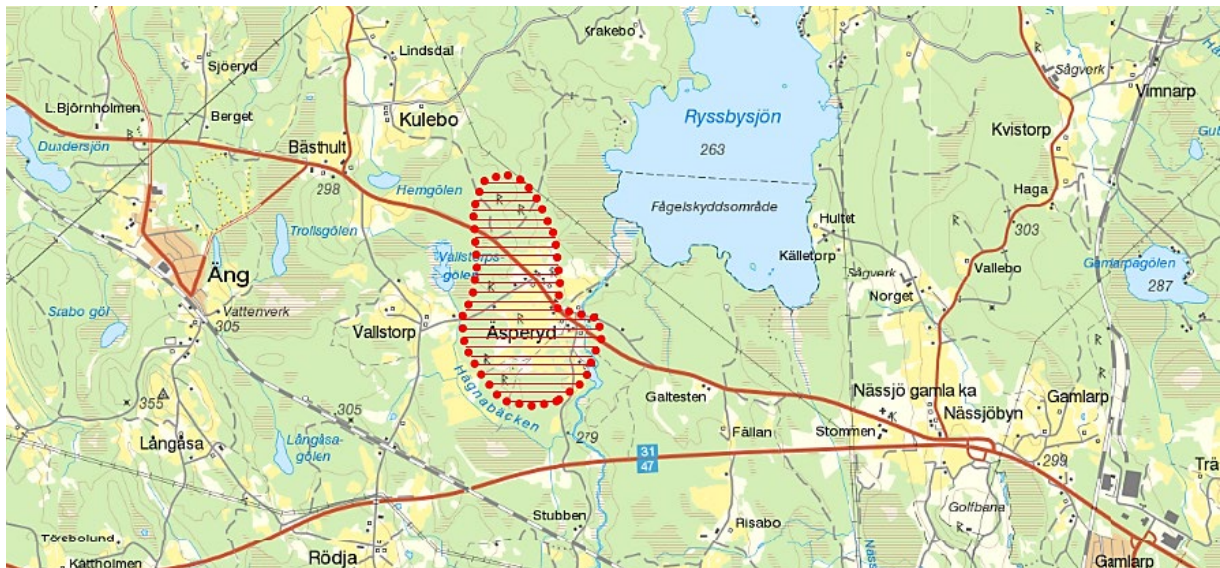
Kartbild från länsstyrelsen.

I kommunens nordvästra del, ett par kilometer söder om Barkeryds kyrkby, ligger fornlämningsområdet och byn Esperyd, ibland stavat Äsperyd. Området är beläget i ett öppet och lätt kuperat odlingslandskap genom vilket den gamla landsvägen mellan Nässjö och Jönköping sträcker sig. Längst i öster passerar Fredriksdalsån. Bebyggelsen uppvisar ett samlat mönster och är företrädesvis belägen utmed landsvägen och koncentrerad till områdets östra delar. Fornlämningssmiljöer från skilda tidsåldrar är spridda inom hela området.