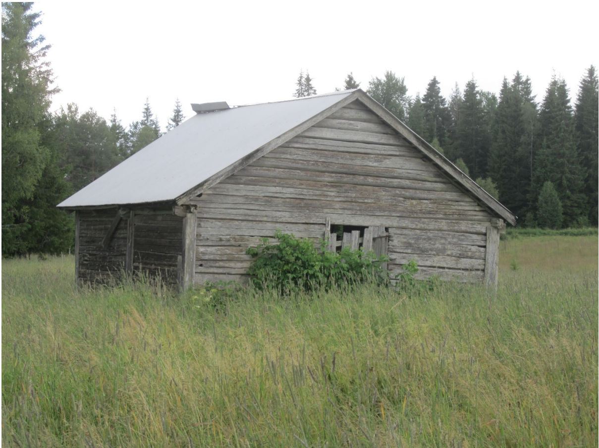
Ångsladan på Berg 1:8.