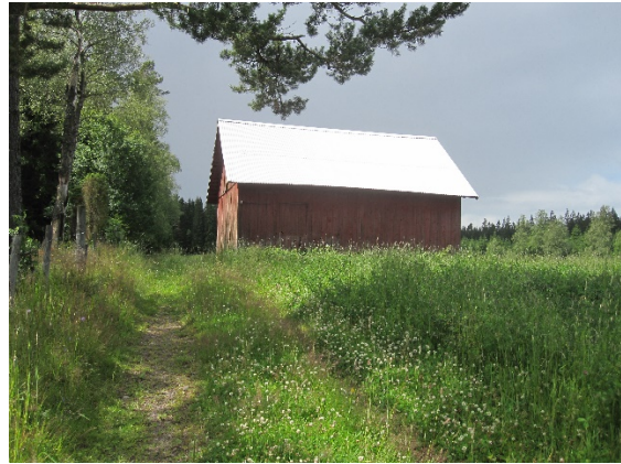
Ångslador på fastigheterna Berg 1:8 och Berg 1:11.