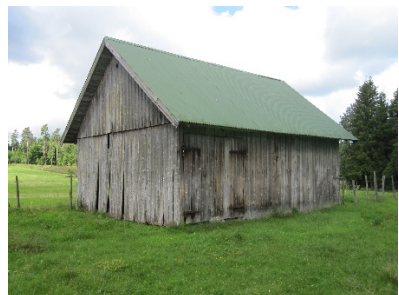
Ångsladorna på Berg 1:8, Berg 1:10 och Berg 1:9.