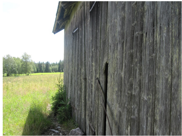
Ängsladorna på Berg 1:17 och Berg 1:2.